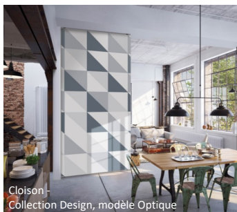
Cloison - Collection Design, modèle Optique