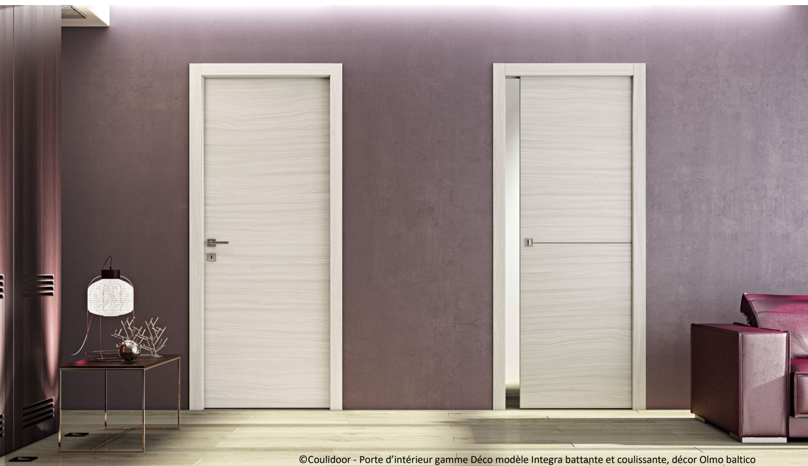
©Coulidoor - Porte d'intérieur gamme Déco modèle Integra battante et coulissante, décor Olmo baltico

À découvrir au salon Artibat du 13 au 15 octobre à Rennes.