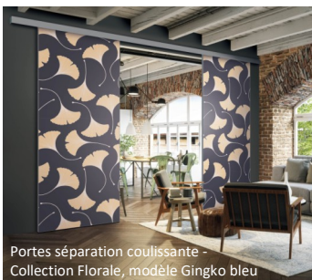
Portes séparation coulissante - Collection Florale, modèle Gingko bleu