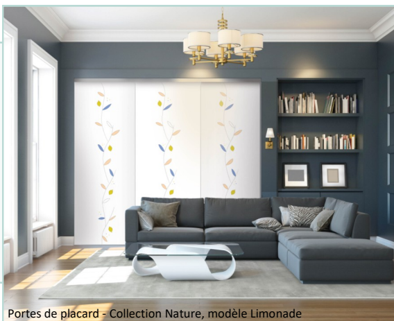
Portes de placard - Collection Nature, modèle Limonade

Grande nouveauté de cette année 2021, Imago® a été lancé en février dernier et séduit déjà par sa simplicité d'installation comme par ses nombreux habillages tendances . Façades de placard, séparations de pièces, séparateurs de bureaux ou cloisons, Imago se compose de 4 grandes familles de produits pour répondre aux besoins d'aménagement des professionnels comme des particuliers. Avec sa toile résistante et lavable qui se change en quelques mouvements, cette collection se glisse dans tous les intérieurs et peut évoluer avec le temps.