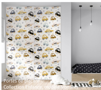
Portes de placard - Collection Enfance, modèle Voitures